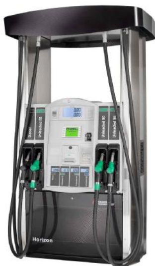
Рисунок 1. Колонка топливораздаточная Horizon.